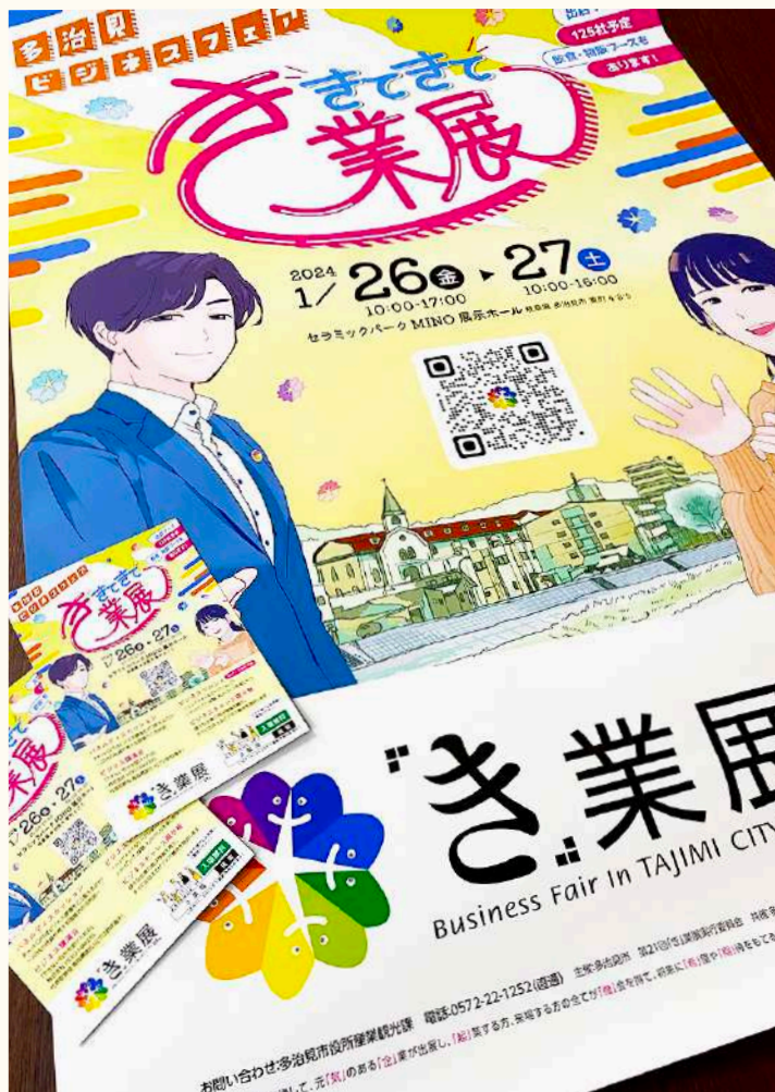
ポストカード(左)／ポスター(右)

イベントのオンライン化が加速する中、その場でBtoBに繋がる出会いや、多治見市を中心に中部地方一円の地域活性化を目指し、リアルイベントとして開催されている「き」業展。今回は長きに渡りSMC-POWERでメインビジュアルをはじめとした印刷物やweb制作に携わせていただいている「き」業展の制作実績をご紹介します。